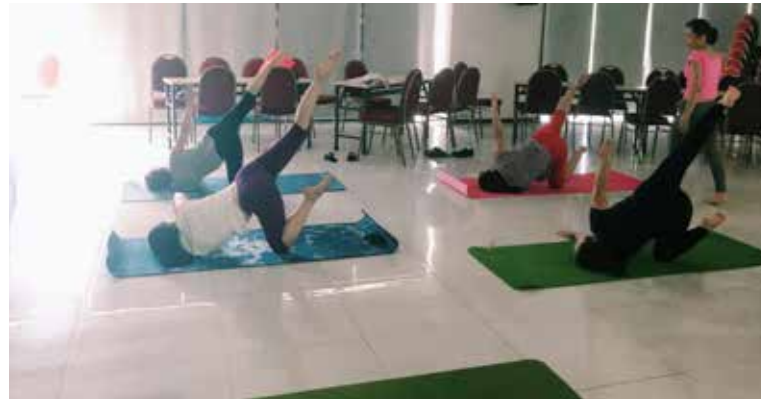
CLB Yoga được duy trì gần 5 năm. Các chị em muốn sức khỏe dẻo dai, thân hình cân đối thì đừng bỏ qua CLB Yoga.