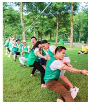
Các trò chơi tập thể.