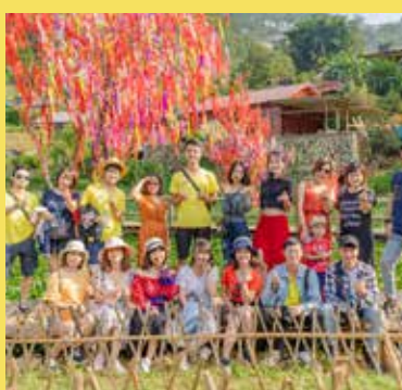
Khám phá bản Cát Cát xinh đẹp.