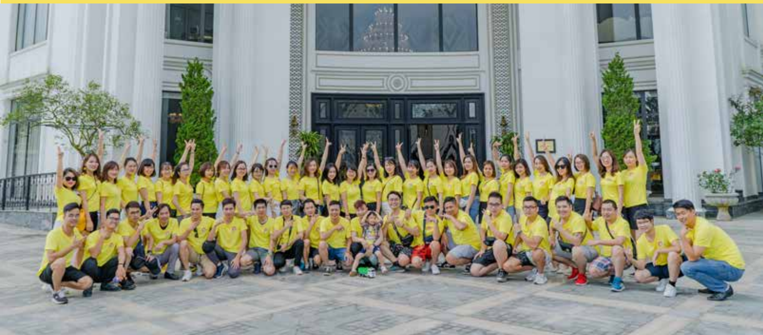
Đội hình "quẩy tới bến" của RSM.

Tạm biệt những ngày làm việc mệt mỏi, căng thẳng, RSM đã tổ chức chuyến đi thanh xuân đến thị trấn Sapa xinh đẹp. Chuyến đi này không chỉ giúp toàn bộ anh chị em RSM thư giãn, tiếp thêm năng lượng mà còn thắt chặt tinh thần đoàn kết trong toàn thể công ty. Mọi người có nhiều khoảng thời gian bên nhau, cùng vui, cùng chơi, cùng ăn uống, hát hò, cùng đi khám phá thiên nhiên hùng vĩ của mảnh đất Sapa... Chắc chắn, mỗi anh chị em RSM đều lưu giữ những kỉ niệm ấy trong thời thanh xuân của mình.