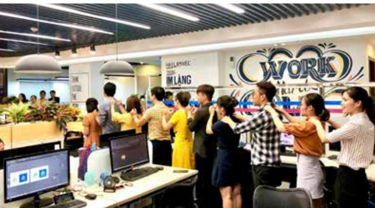
Hoạt động “xoa, bóp, đấm” của RSM Hà Nội được diễn ra thường xuyên vào đầu giờ chiều. Mục đích lớn nhất là để ACE tỉnh táo, tinh thần hưng phấn nhất để giải quyết công việc.