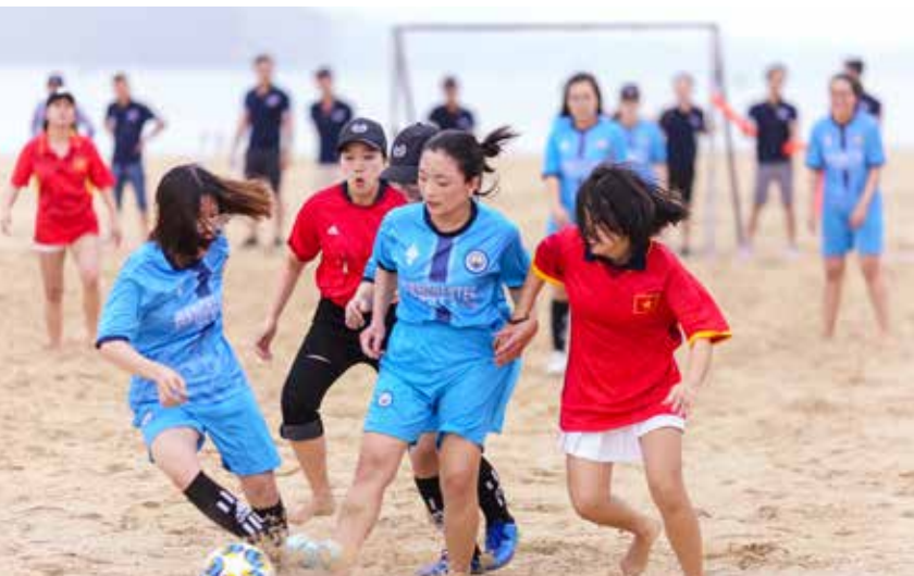
S9 mở màn với là giải bóng đá nữ cực chất không kém gì bóng đá nam.

Bí quyết nào đã giúp một tập thể như S9 trở nên vững mạnh, liên tiếp phá vỡ những kỷ lục của CenLand, tự tin tiến đến mục tiêu 300 tỷ vào cuối năm 2019? Câu trả lời chính là “tinh đoàn kết”! Dịp sinh nhật 4 năm, S9 đã khiến ACE trầm trở về độ “vui chơi” xõa tới bến.