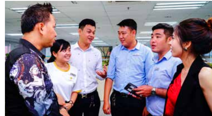
Câu lạc bộ thiện nguyện với lượng thành viên rất đông đảo.

Chỉ trong một thời gian ngắn phát động, các Cenner Sài Gòn đã rất nhanh tay đăng ký tham gia hoạt động trong các CLB của Ban Văn Hóa thành lập. Hãy cùng BBT Ra Khơi ngắm những hình ảnh đầu tiên của các thành viên trong các CLB nhé!