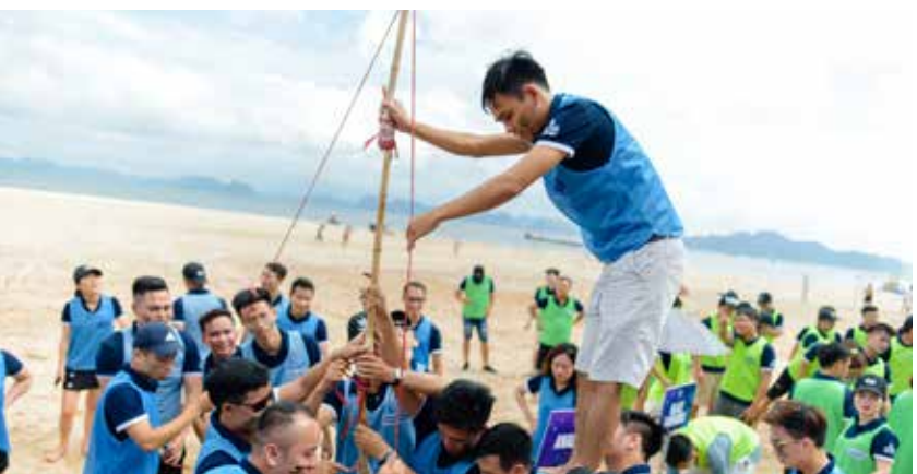
Các trò chơi team building trên bãi biển đảm bảo cực độc.