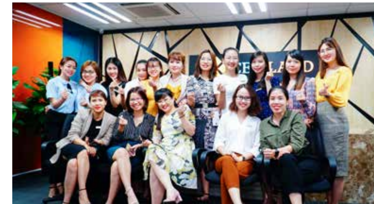
Câu lạc bộ Yoga.

Các câu lạc bộ Yoga, Bóng Đá và Gym... cũng đã lên kế hoạch và lịch tập luyện cho các thành viên. Có thể nói, việc ra mắt Ban văn hóa của tập đoàn là chương trình hết sức ý nghĩa, vì thông qua các câu lạc bộ, các thành viên ở các phòng ban có cơ hội gặp gỡ và hiểu nhau nhiều hơn.