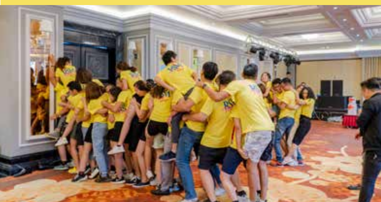
Team building cực chất với những phần thi không thể đọc - lạ hơn.