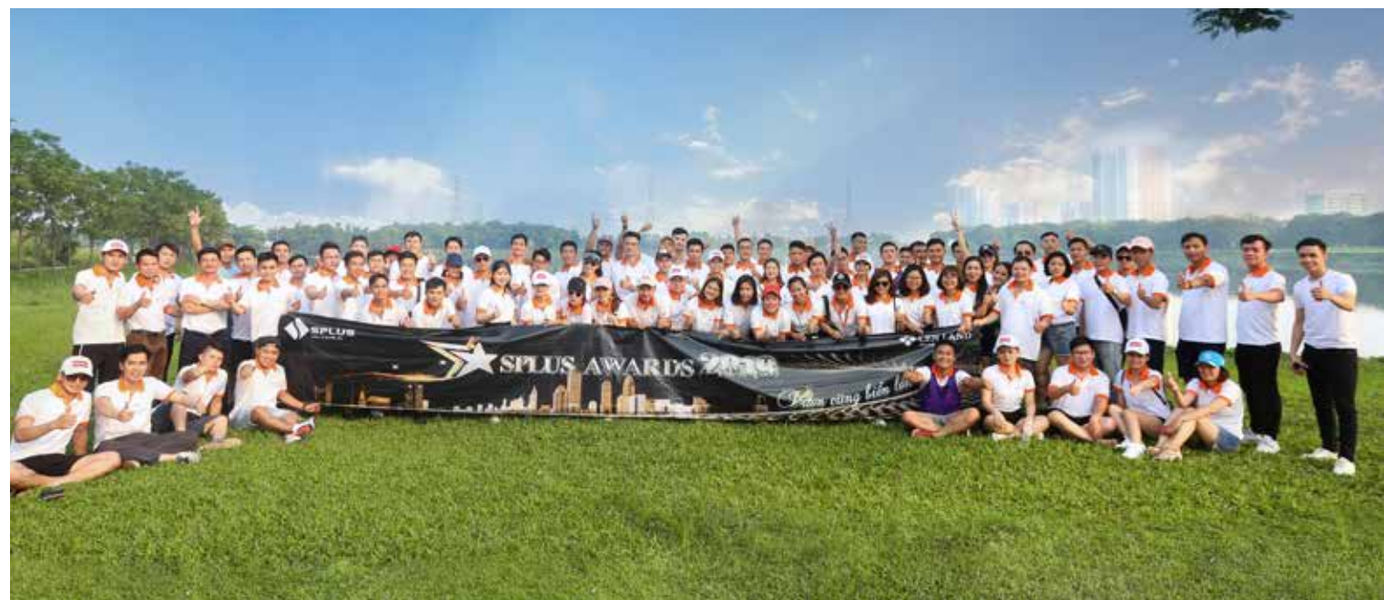
Đại gia đình Splus trong ngày team building nắng đẹp.

Đến hẹn lại lên, chuỗi hoạt động team building của STDA đang nóng hơn bao giờ hết. Hòa chung cùng bầu không khí đó là sự kiện team building “SPlus Awards 2019 vườn cùng biển lớn”. Đây không chỉ đơn thuần là sự kiện team building SPlus Awards còn là nơi để vinh danh các cá nhân, tập thể có thành tích xuất sắc, góp phần vào sự thành công chung của đại gia đình SPlus.