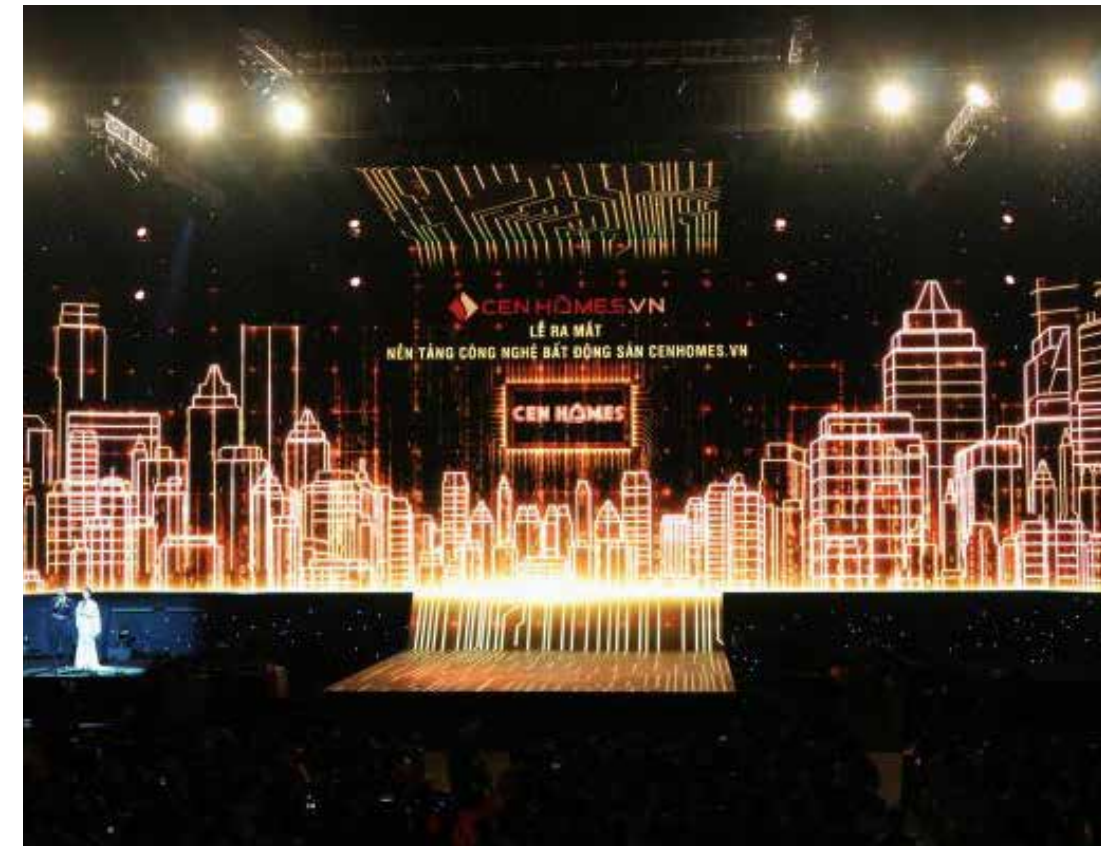
Lễ ra mắt đậm chất công nghệ của Nền tảng công nghệ BĐS cenhomes.vn

Bằng việc kết hợp giữa công nghệ, CenHomes đã số hóa các thông tin liên quan đến bất động sản, chung cư, căn hộ đưa lên một trang thông tin công khai, tạo ra nơi giao dịch bất động sản tập trung, minh bạch.