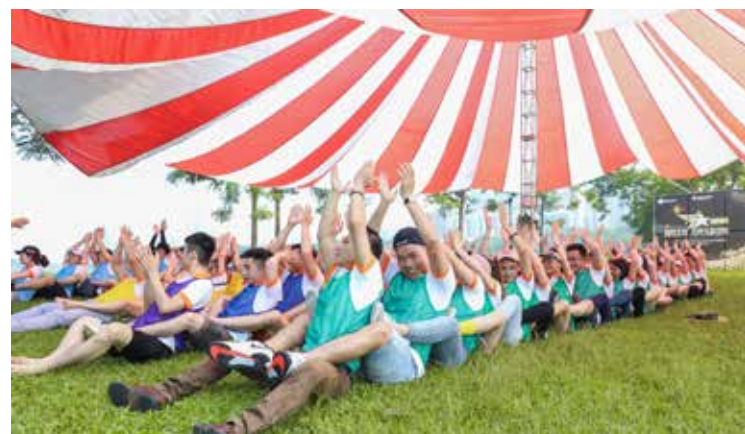
Warm Up đồng đội – Giơ tay cao lên nào.