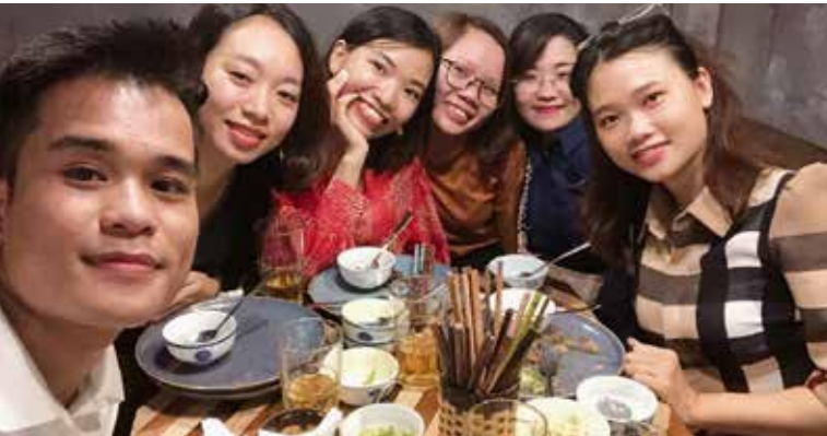
CLB ăn chay quy tụ hội “Độc toàn thân” (Độc thân :D).

Làm mưa gió trên diễn đàn “chéo” của ACE nhà Cen, Hà Nội đã “mở bát” cực chất với nhiều hoạt động văn hóa sôi nổi. Cùng BBT Ra Khơi ngắm những bức ảnh “hoa lệ” ấy thêm một lần nữa nhé!