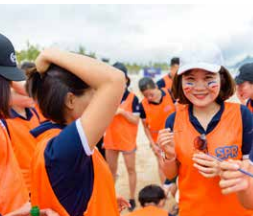
Khuôn mặt được trang điểm với tiêu chí “độc-lạ”.