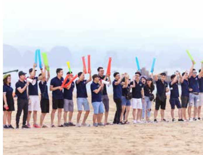
Warm up bằng màn khởi động tập thể.