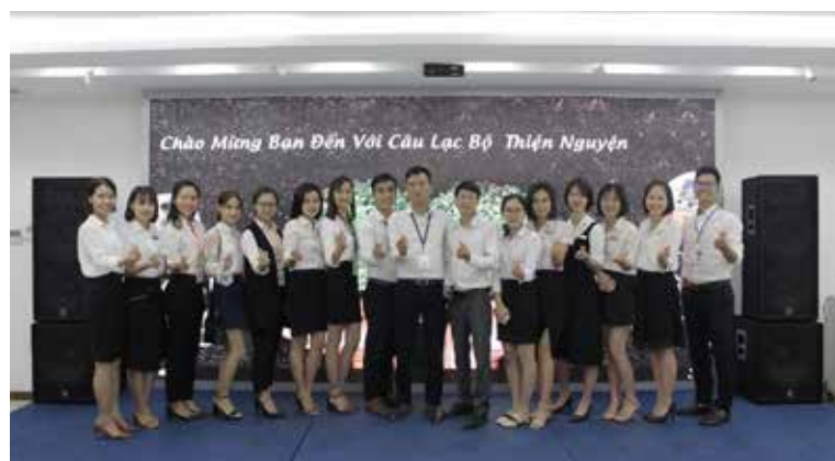
CLB Thiện nguyện chính thức ra mắt với lực lượng đông đảo nhất.