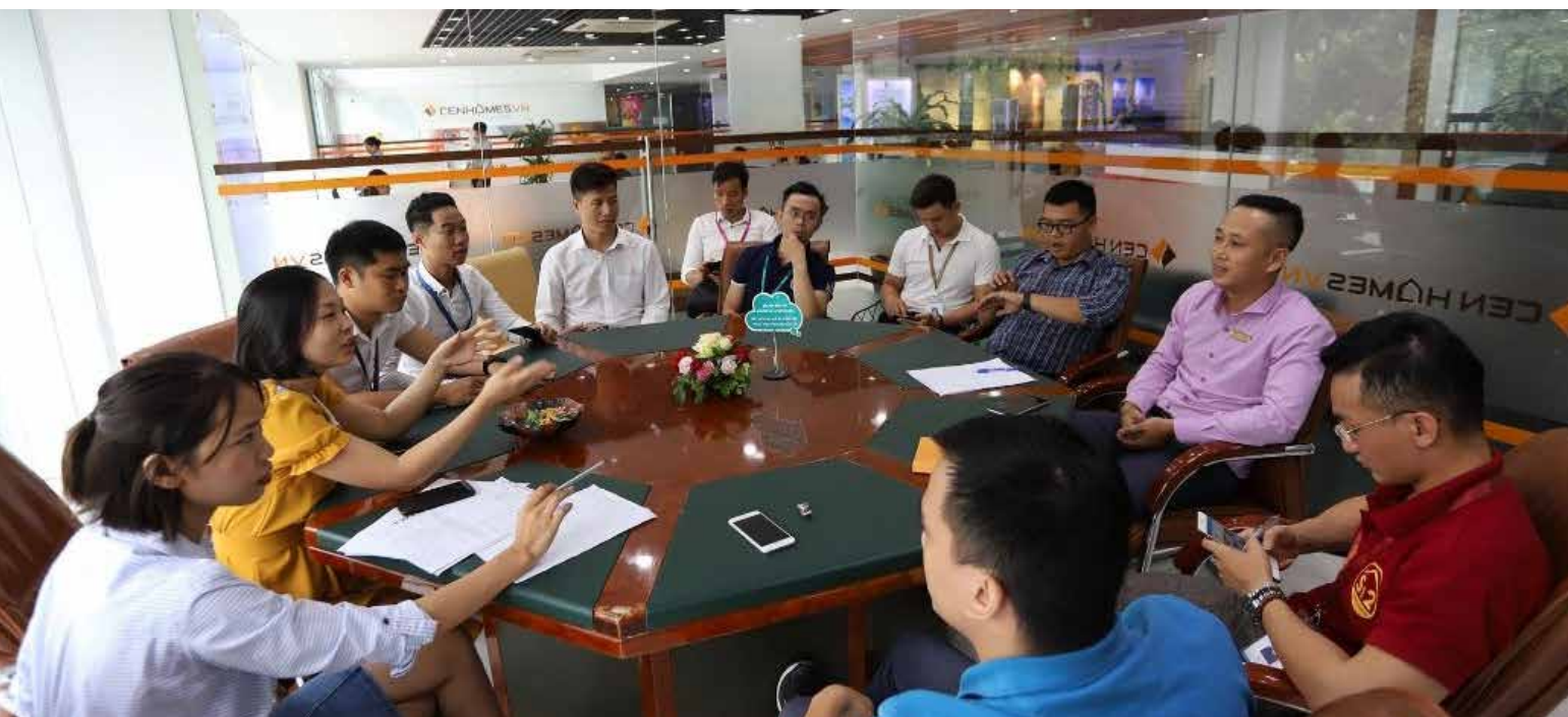
CFF họp bàn để phát triển thêm nhiều hoạt động trong thời gian tới.