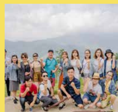
Đội hình trekking 7km nhưng vẫn rất tràn đầy năng lượng.