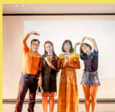
Hoa hậu, Á hậu 1 & Á hậu 2 của cuộc thi Miss RSM lần thứ 1.