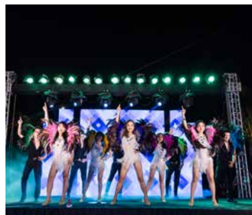
Cùng nhau tỏa sáng trên sân khấu.