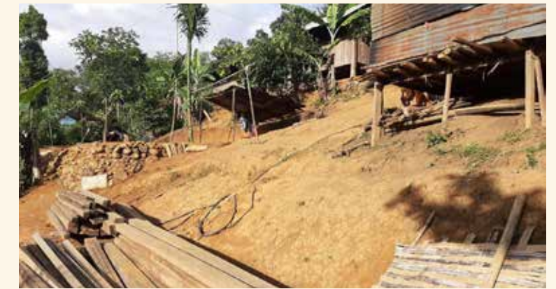
Hộ dân mà Quỹ HỖVNÀ xây tặng nhà

Trước đó, vào cuối tháng 8, Quỹ HỖVNÀ đã phối hợp cùng báo Pháp luật Việt Nam trao tặng 15 triệu đồng cho người dân bị thiệt hại sau bão lũ tại xã Na Mèo, huyện Quan Sơn, tỉnh Thanh Hóa.