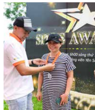
Trao giải cho các cá nhân có thành tích xuất sắc.